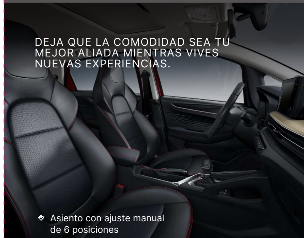
◆ Asiento con ajuste manual de 6 posiciones

DEJA QUE LA COMODIDAD SEA TU MEJOR ALIADA MIENTRAS VIVES NUEVAS EXPERIENCIAS.