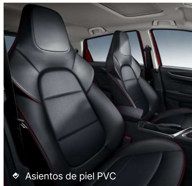
◆ Asientos de piel PVC