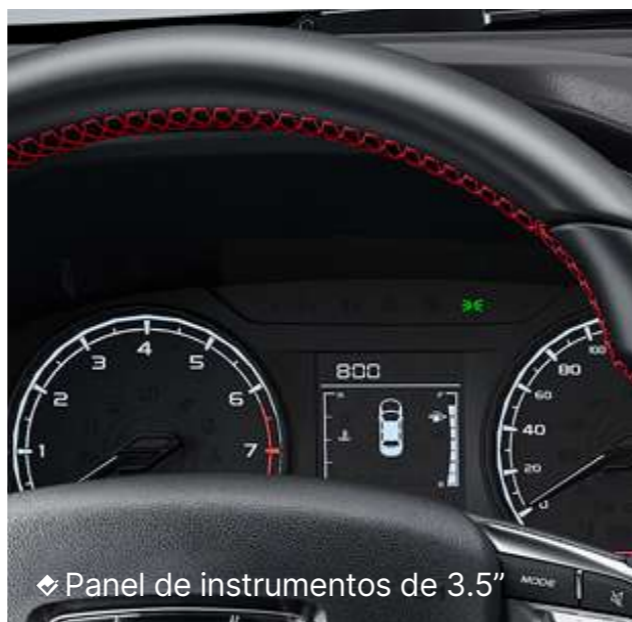
◆ Panel de instrumentos de 3.5"

DEJA QUE LA COMODIDAD SEA TU MEJOR ALIADA MIENTRAS VIVES NUEVAS EXPERIENCIAS.