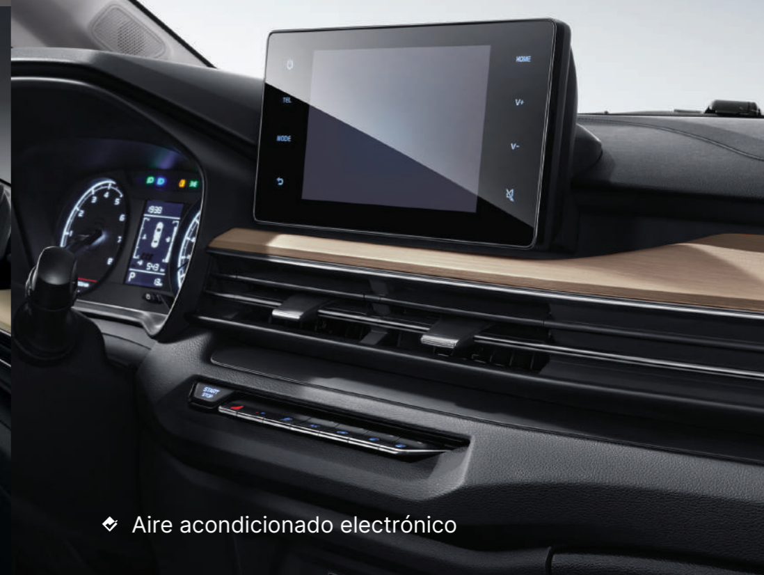
◆ Aire acondicionado electrónico

◆ Volante de piel PVC multifunción + control de crucero + limitador de velocidad