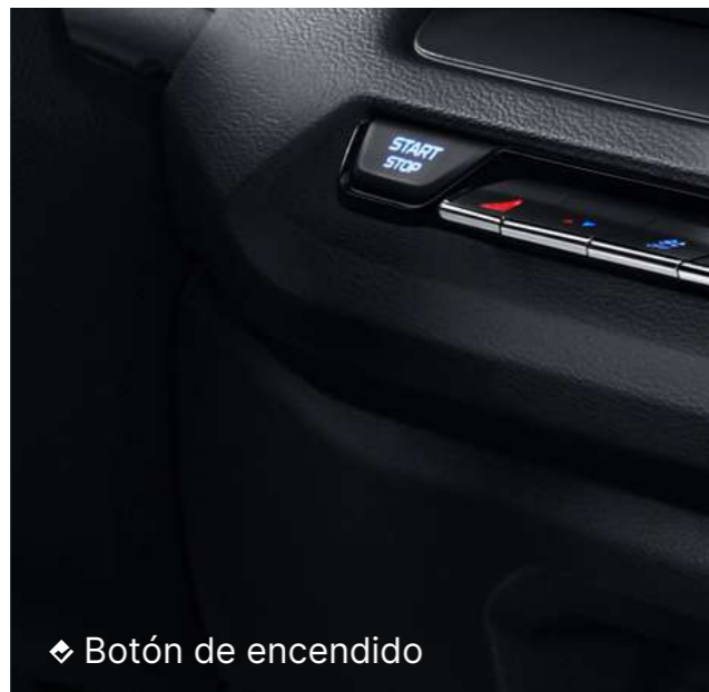
◆ Botón de encendido