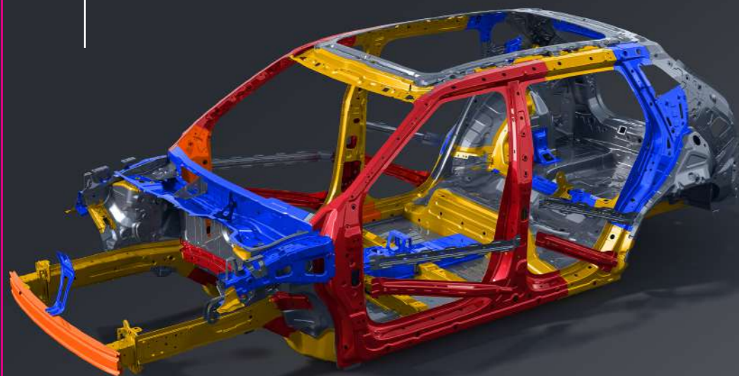
❖ Frenos de disco en las cuatro ruedas con asistencia de frenado y estabilidad ABS, EBD, BA, TCS, ESC