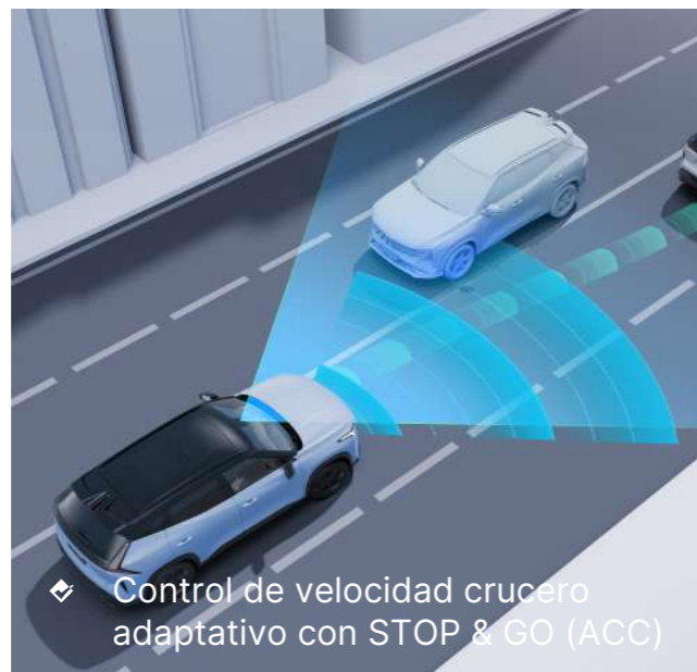
❖ Control de velocidad cruceo adaptativo con STOP & GO (ACC)