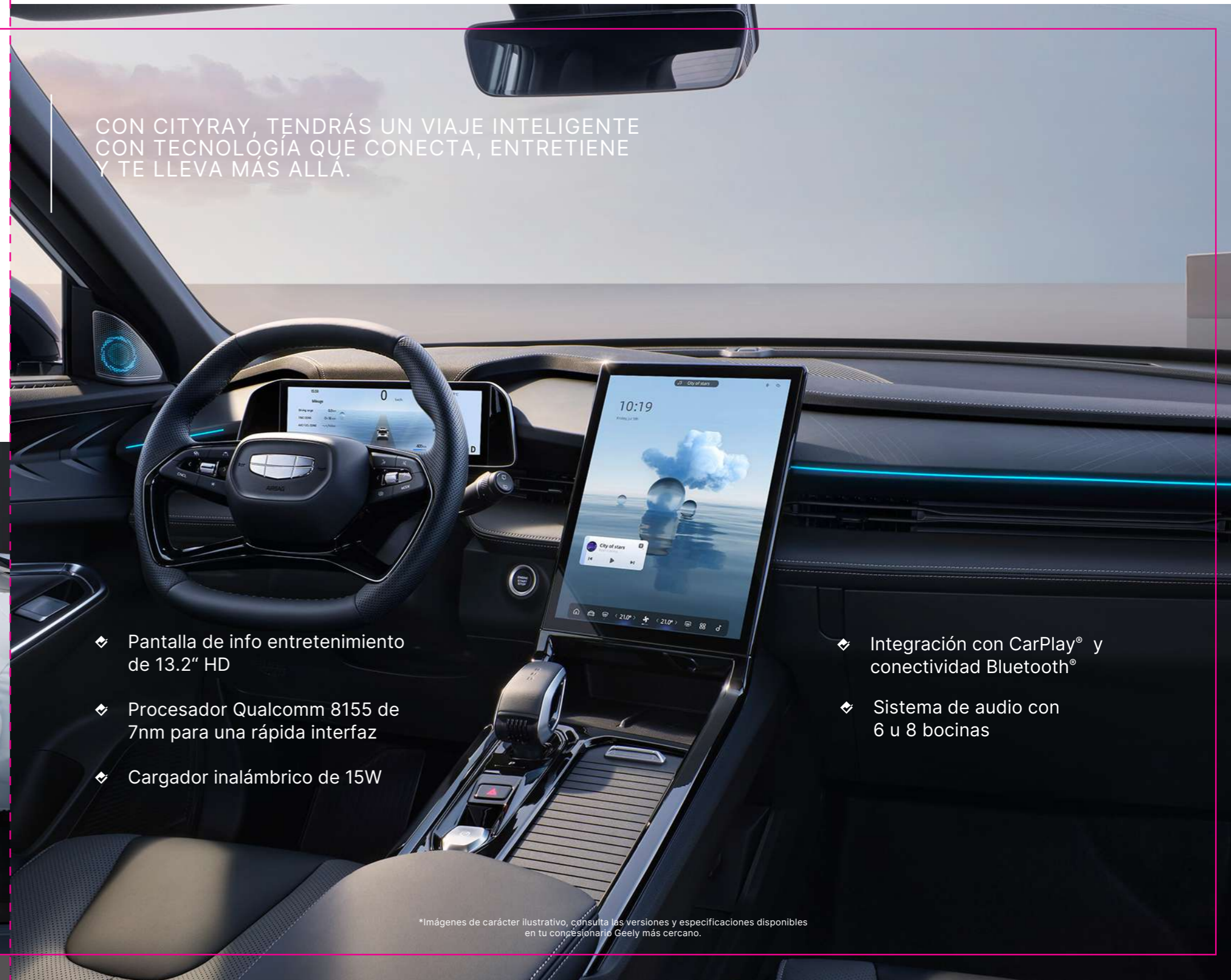
❖ Pantalla de info entretenimiento de 13.2" HD

CON CITYRAY, TENDRÁS UN VIAJE INTELIGENTE CON TECNOLOGÍA QUE CONECTA, ENTRETIENE Y TE LLEVA MÁS ALLÁ.