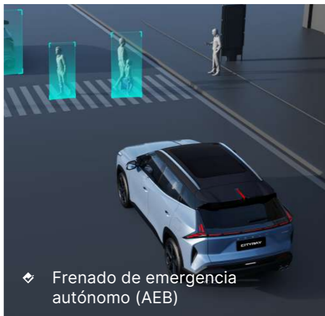
❖ Frenado de emergencia autónomo (AEB)