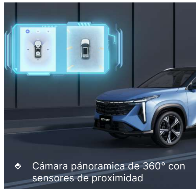
❖ Cámara panorámica de 360° con sensores de proximidad