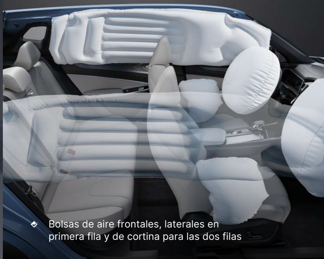
❖ Bolsas de aire frontales, laterales en primera fila y de cortina para las dos filas

*Imágenes de carácter ilustrativo, consulta las versiones y especificaciones disponibles en tu concesionario Geely más cercano.